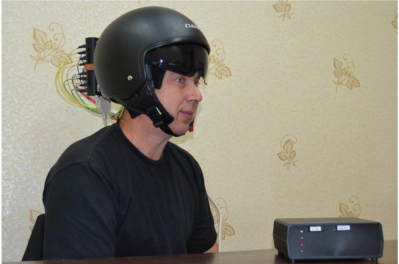
Випробування шолома, під'єданого до мікропроцесорного блоку управління

Попередні результати випробування розробки (зокрема й бійцями колишнього добровольчого батальйону, а нині – добровольчої роти патрульної служби поліції особливого призначення «Миротворець») засвідчили її високу ефективність. Це дає науковцям підстави сподіватися на налагодження в подальшому серійного виробництва шолома з інтелектуальною системою корекції психофізіологічного стану людини.