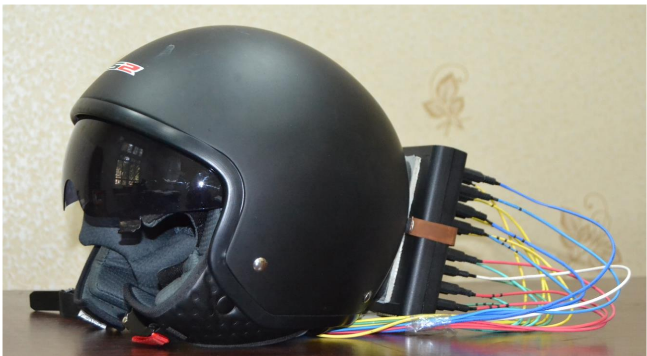
Загальний вигляд шолома, створеного вченими ІПШІ НАН України

Технічні засоби шолому імітують процедури масажу з одночасним вимірюванням і контролем фізіологічних показників, а саме: частоти серцевих скорочень, шкірно-гальванічної реакції, активності периферичної серцево-судинної системи тощо.