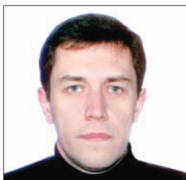
ДАВИДОВСЬКИЙ Володимир Володимирович — доктор фізико-математичних наук, завідувач відділу теорії ядерних процесів Інституту ядерних досліджень НАН України