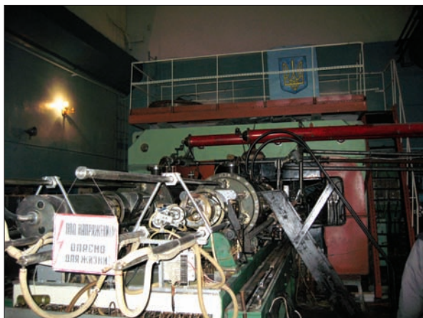
Рис. 1. Циклотрон У-120 Інституту ядерних досліджень НАН України