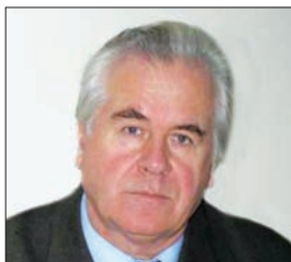
ВИШНЕВСЬКИЙ Іван Миколайович — академік НАН України, почесний директор Інституту ядерних досліджень НАН України