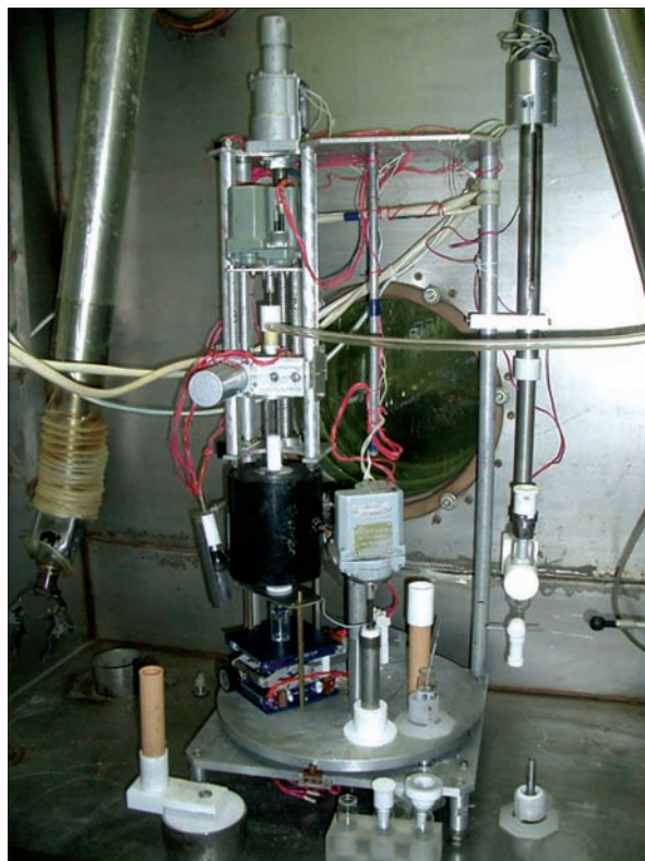
Рис. 4. Установка для виробництва капсул натрію йодиду ( ^{131}\text{I} )

Стурбованість суспільства дещо нівелюється зростанням продовольчої проблеми, зокрема необхідністю вирішення питань державного регулювання безпечності та якості харчових продуктів. Зростають потреби в консервуванні і зберіганні продуктів харчування за допомогою сучасних технологій, розробленні нових технологій, розбудові мережі сучасних лабо-