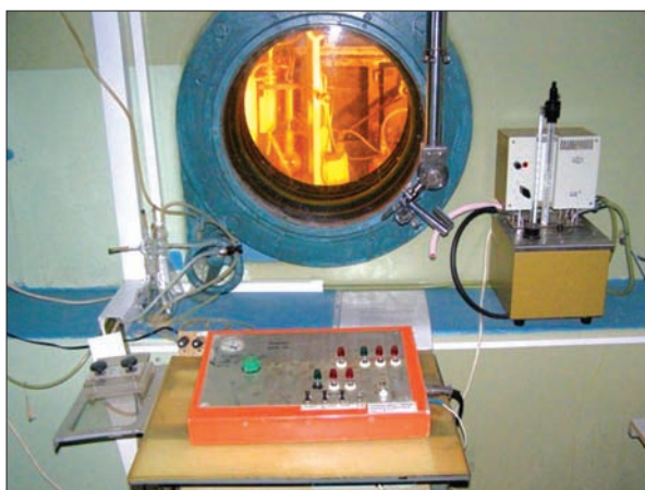
Рис. 3. Гаряча камера стаціонарного екстракційного генератора ^{99m}\text{Tc}

гію отримання елюату натрію пертехнетату- ^{99m}\text{Tc} – радіофармпрепарату, який широко використовують у ядерній медицині для діагностики пухлин різних локалізацій і непухлинної патології організму (рис. 3); технологію виробництва розчину натрію йодиду ( ^{131}\text{I} ) – радіофармпрепарату, який застосовують у ядерній медицині для діагностики і терапії раку щитоподібної залози та його метастазів; технологію виробництва капсул натрію йодиду ( ^{131}\text{I} ) (рис. 4).