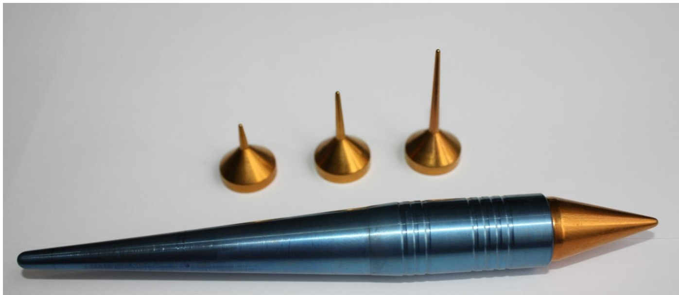
Магніт офтальмологічний Nd 2 Fe 14 B (покриття – TiN) зі змінними насадками для видалення куль та металевих уламків з очей

На основі багаторічного досвіду з розробки та виготовлення магнітних систем широкого призначення та з урахуванням новопосталих обставин і ними спричинених потреб вченими ІФТТМТ ННЦ «ХФТІ» було створено спеціальні магнітні пристрої на базі постійних магнітів Sm-Co і Nd-Fe-B. Дві конструкції магнітного уловлювача першого покоління на основі магнітів Nd-Fe-B було виготовлено в жовтні 2014 року, потужнішу модель другого покоління – у березні 2015 року. Фахівці установи розробили також окремий високоенергетичний офтальмологічний магніт із біологічно інертним покриттям.