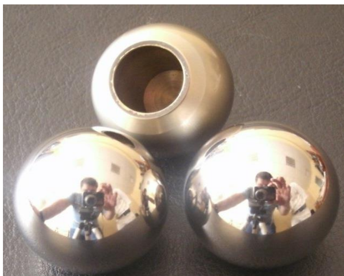
Розроблені фахівцями Інституту надтвердих матеріалів імені В.М. Бакуля НАН України сферичні головки з чистого титану для ендопротезів кульшового суглобу

Одним із важливих чинників, який визначає надійність і довговічність ендопротезу, є конструкція та триботехнічні властивості (коефіцієнт тертя і зносостійкість) шарнірної пари. Нині в Україні переважній більшості пацієнтів імплантують ендопротези, шарнірну пару яких складає головка зі сплаву CoCrMo (кобальт-хром-молібден) і ацетабулярний компонент із високомолекулярного поліетилену. Однак, із точки зору біосумісності, такий сплав не є найкращим матеріалом для виготовлення ендопротезів, імплантованих у людське тіло. До того ж, імпланти із зазначеного сплаву протипоказані пацієнтам, хворим на ниркову недостатність, та жінкам репродуктивного віку.