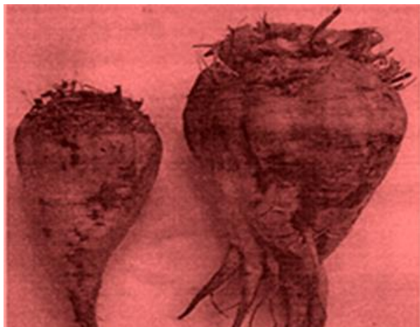
Ліворуч – коренеплід цукрового буряка, вирощеного на неочищеному полі, праворуч – вирощеного на полі, очищеному «Агродетоксом»

Зазначений препарат є специфічним біосорбційним матеріалом, який містить комплекс мікроорганізмів-деструкторів пестицидів різного хімічного складу, іммобілізованих на сорбційному композиті рослинного походження, активному як щодо пестицидів, і так і щодо мікроорганізмів. Польові експериментальні дослідження із застосування детоксиканту «Агродетокс» для очищення ґрунтів на дослідних полях на Київщині (с. Мирівка, Кагарлицький район) від залишків пестицидів засвідчили високу ефективність препарату . Науковці, наприклад, встановили, що під час вегетаційного періоду розвитку цукрових буряків зелена маса цих рослин зросла на 20-30%, а вага коренеплодів, вирощених на дослідній ділянці, перевищувала вагу коренеплодів із контрольного поля в 1,5 раза. Як з'ясували фахівці ІСПЕ НАН України, загальний вміст пестицидів у досліджуваних ґрунтах зменшився на 89% .