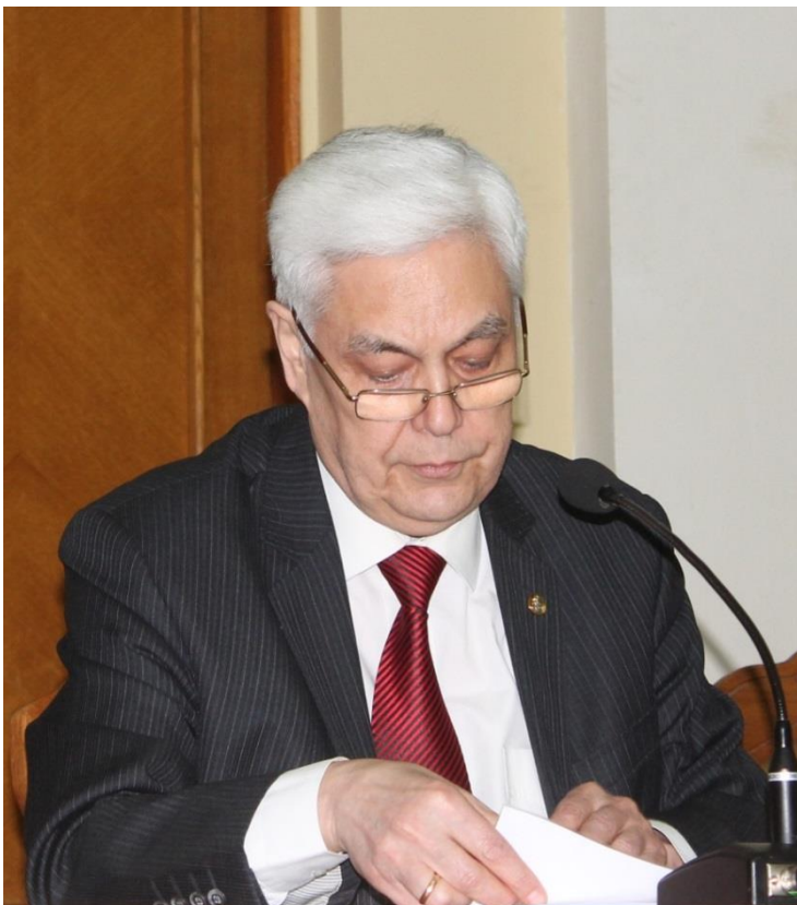
Віце-президент НАН України, голова Секції суспільних і гуманітарних наук НАН України академік С.І. Пирожков

19 лютого 2016 року відбулась Ювілейна сесія Загальних зборів Секції суспільних і гуманітарних наук НАН України, присвячена 150-річчю від дня народження видатного українського історика та правознавця, громадського й державного діяча, одного з ініціаторів створення в 1918 році Української академії наук (пізніше – Всеукраїнської академії наук (ВУАН)) та її другого президента (у 1921-1922 рр.) академіка Миколи Прокоповича Василенка (1866–1935 рр.).