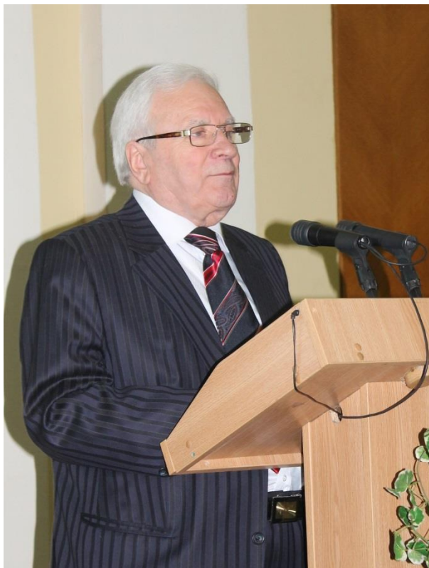
Директор Інституту держави і права імені В.М. Корецького НАН України академік Ю.С. Шемшученко

визначальних подіях у житті академіка М.П. Василенка та розповів про творчу спадщину видатного науковця і його найбільш вагомі здобутки в галузі вивчення історії українського права. Варто підкреслити, що саме академік М.П. Василенко став фундатором наукової школи українського права. Його також вважають одним із основоположників таких напрямів досліджень, як юридична біографістика, юридична історіографія, юридична археографія та юридичне джерелознавство.