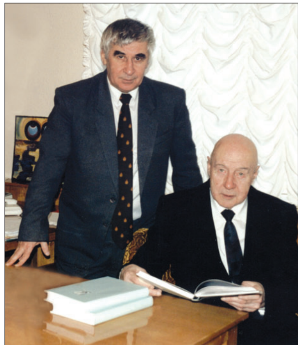
У робочому кабінеті з академіком Ю.О. Митропольським. 2007 р.