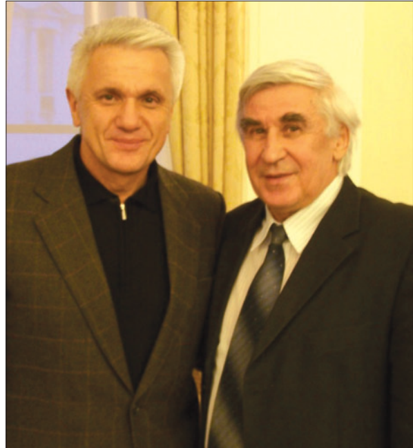
Земляцтво Житомирщини. З академіком В.М. Литвином