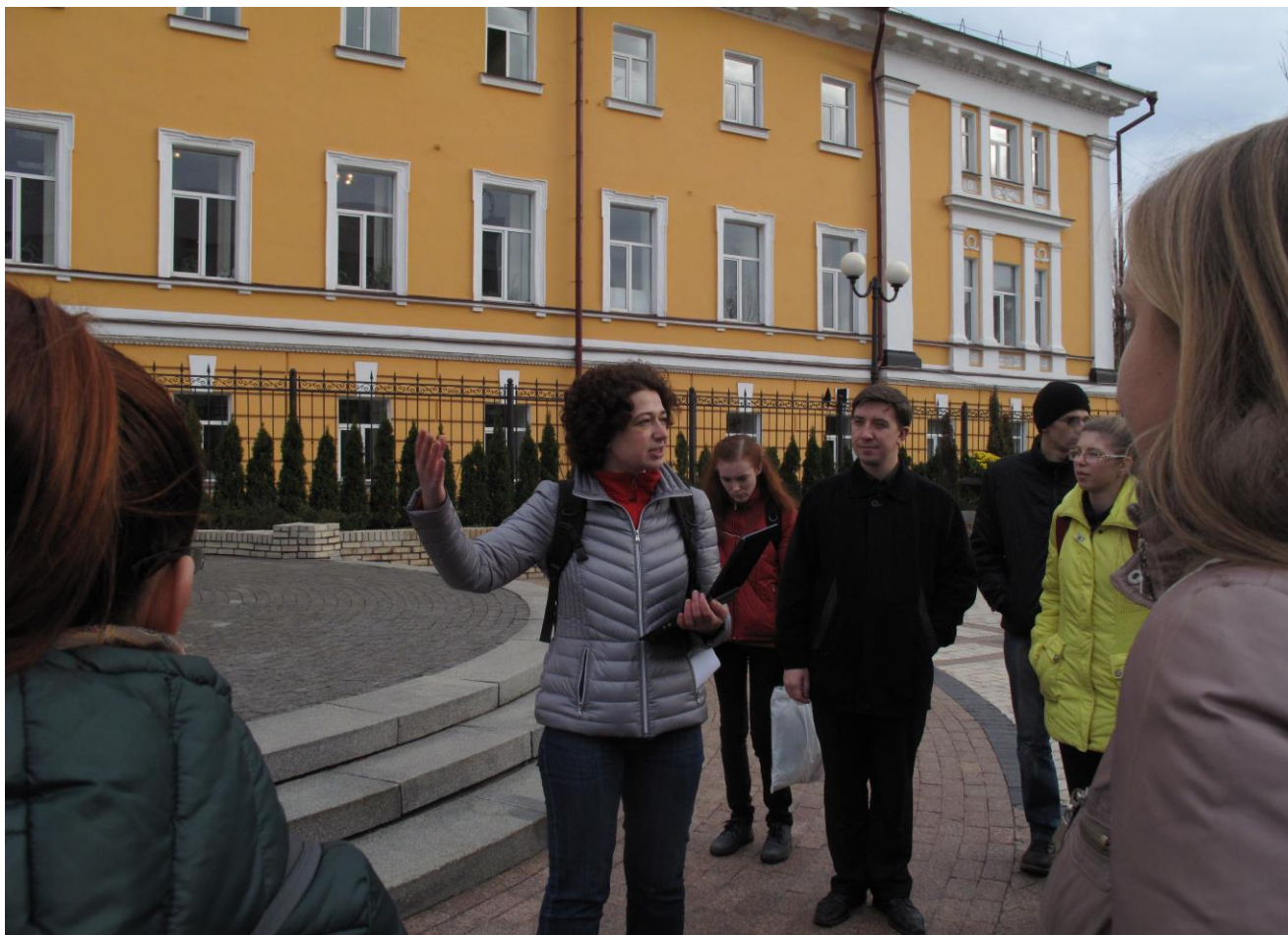
Під час пішохідної екскурсії Академічним кварталом