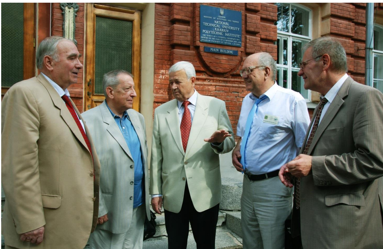
Представники організаційного комітету VII Українського з'їзду з електрохімії

Організаторами заходу виступили Наукова рада НАН України з проблеми «Електрохімія», Національний технічний університет «Харківський політехнічний інститут» (НТУ «ХПІ»), Харківський національний університет імені В.Н. Каразіна, Інститут загальної та неорганічної хімії (ІЗНХ) імені В.І. Вернадського НАН України.