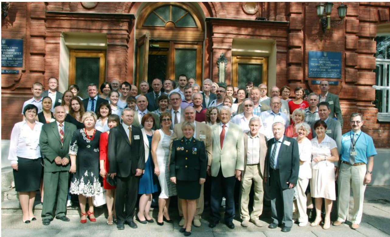
Учасники VII Українського з'їзду з електрохімії

21 – 25 вересня 2015 року в Харкові відбувся VII Український з'їзд з електрохімії в межах програми «Наука заради миру та безпеки».