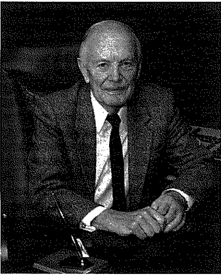
Продовження. Початок у номері № 27 – 28

(Інтерв'ю президента Національної академії наук України академіка Бориса Патона)