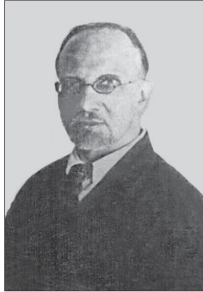
Агатангел Юхимович Кримський, червень 1928 р.

З огляду на відверто неприязну позицію щодо влади С. Єфремова, завуальовану нелояльність А. Кримського та політичну індіферентність В. Липського, М. Грушевський здавався чи не єдиною на академічному терені