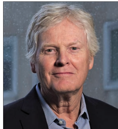
Майкл Янг (Michael W. Young)