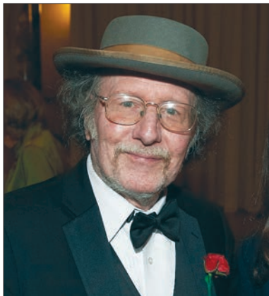
Джеффри Холл (Jeffrey C. Hall)