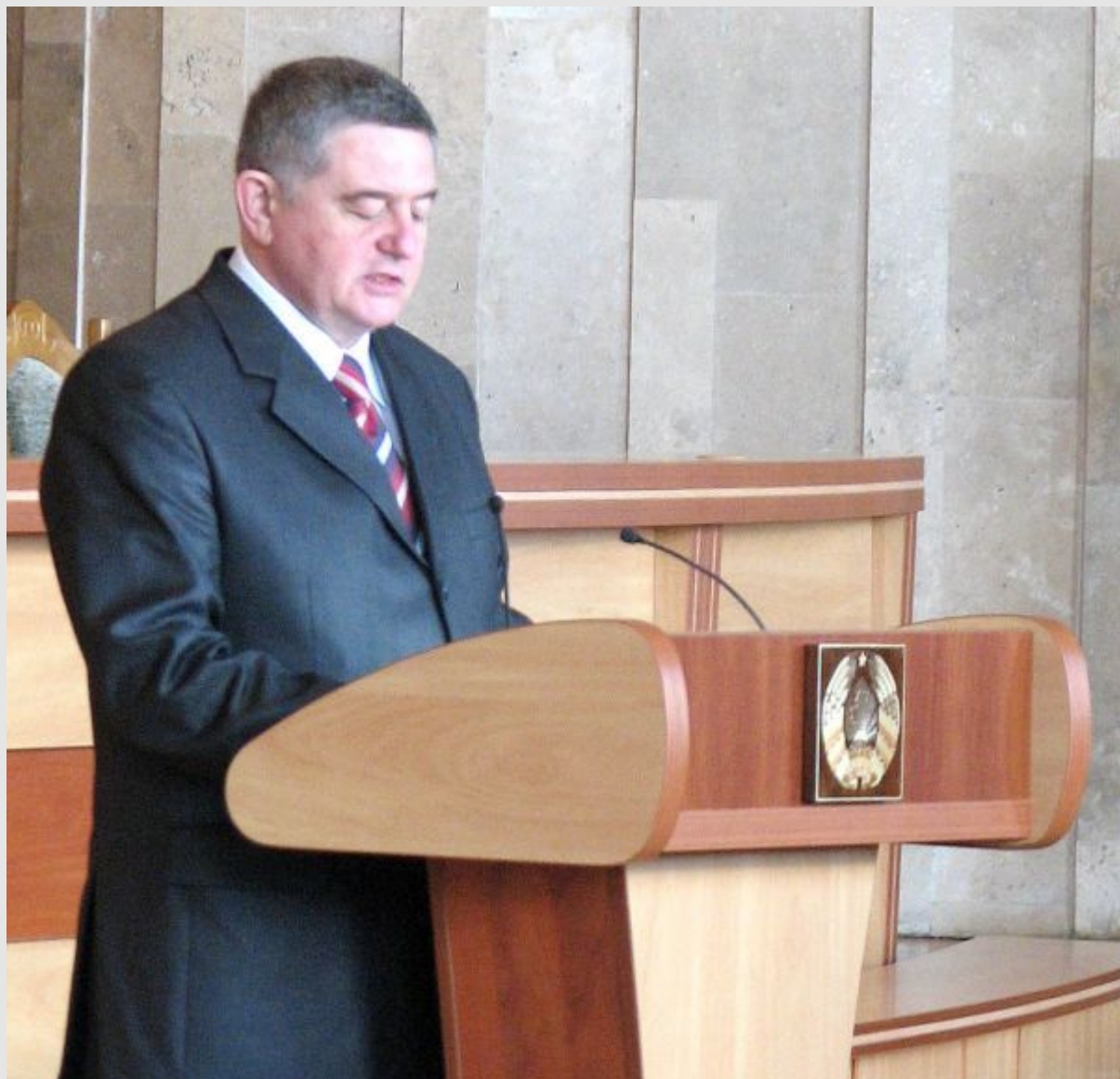
Приветствие официальных представителей Республики Беларусь.