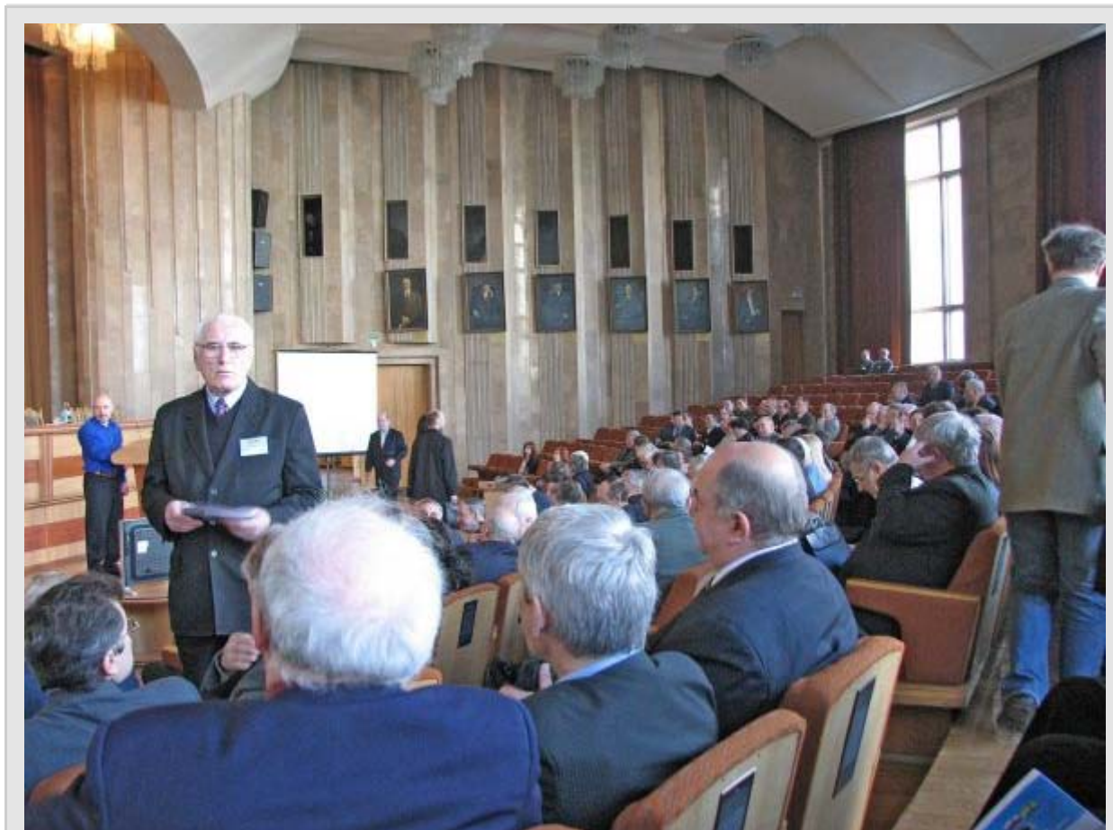
Зал заседаний Президима НАНБ перед пленарными докладами.