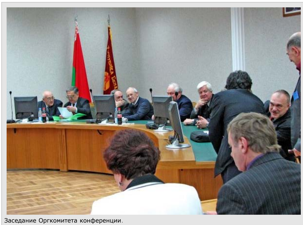
Заседание Оргкомитета конференции.

На конференции присутствовало около 400 участников из Беларуси, Украины, России, стран СНГ.