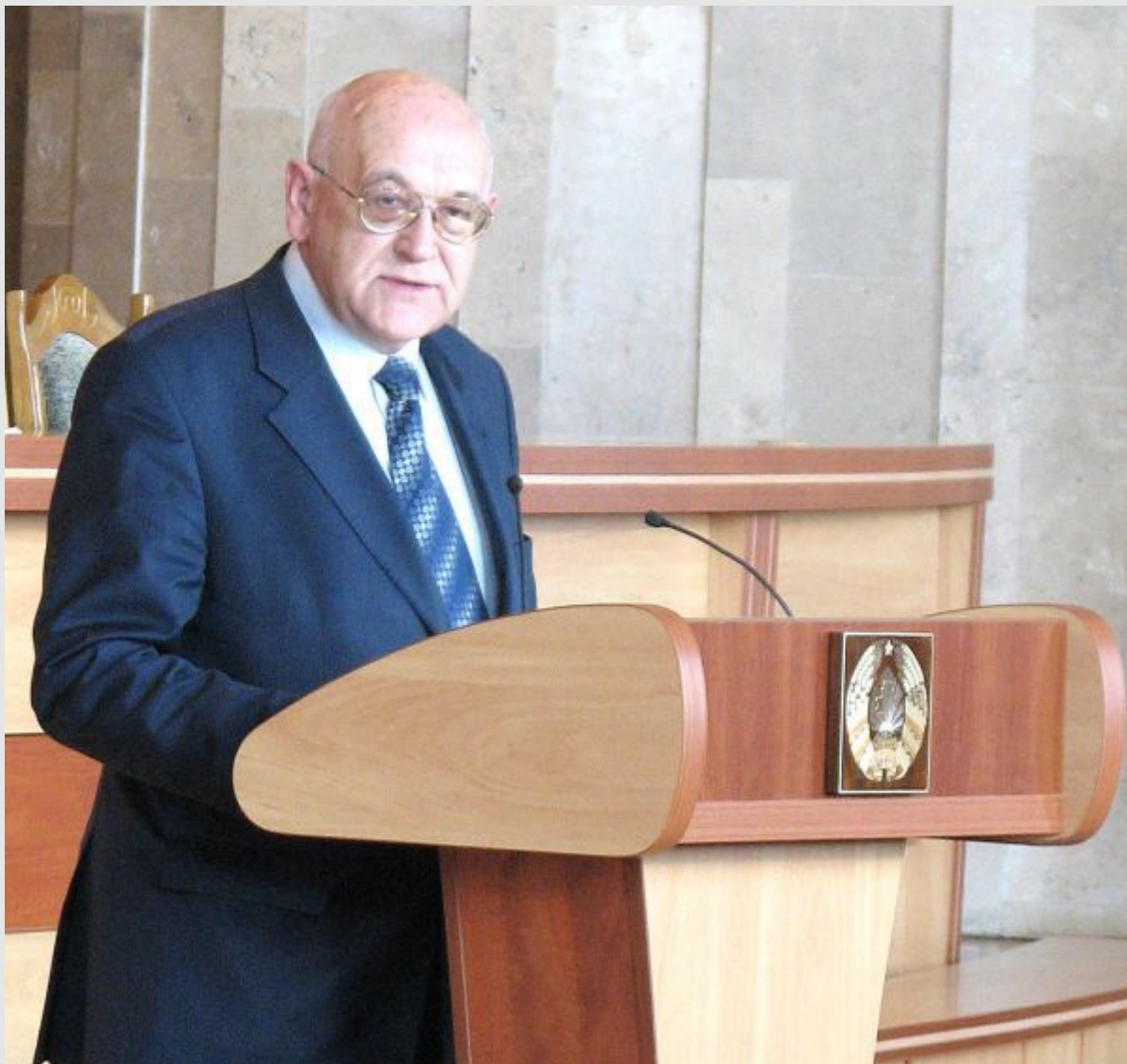
Приветствие представителя фонда фундаментальных исследований Республики Беларусь.